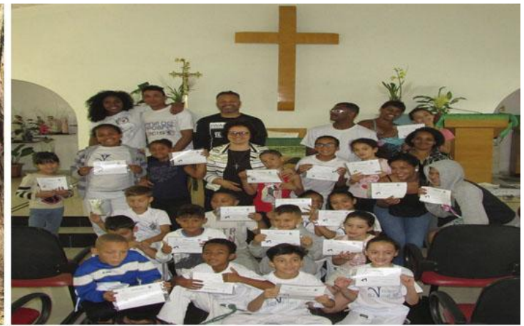
Grupo Quilombolas de Luz Capoeira na Comunidade Nossa Senhora da Salette