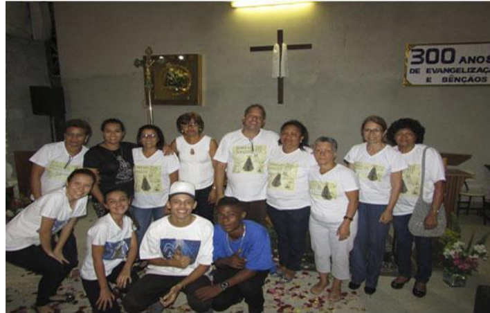
Tríduo Com. Nossa Senhora Aparecida