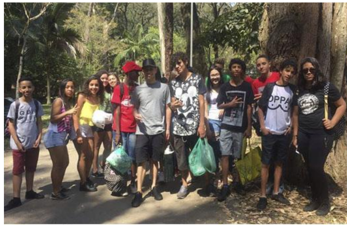
Passeio com a turma do Crisma da Paróquia Nossa Senhora do Carmo