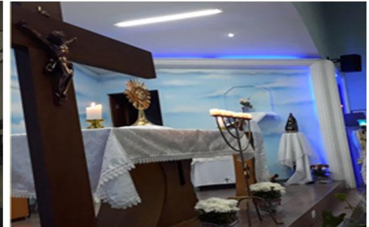
Cerco de Jericó - Com. Nossa Senhora das Graças