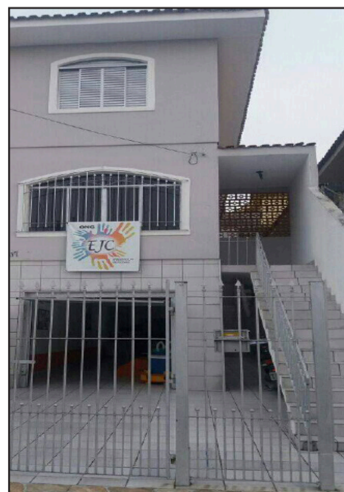
Texto: Simone Carvalho