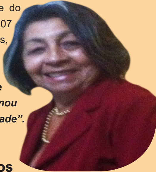
ENTREVISTA E TEXTO: DENISE RAMOS

“Agradeço muito a esta comunidade que me acolheu com muito carinho e me ensinou o verdadeiro significado que é viver em comunidade”.