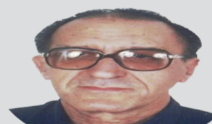
Ático (Vigário: 1999 - 2001)